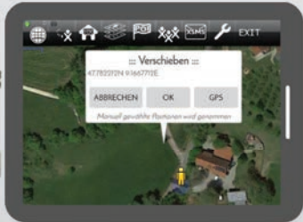
Android Tablet / Smartphone